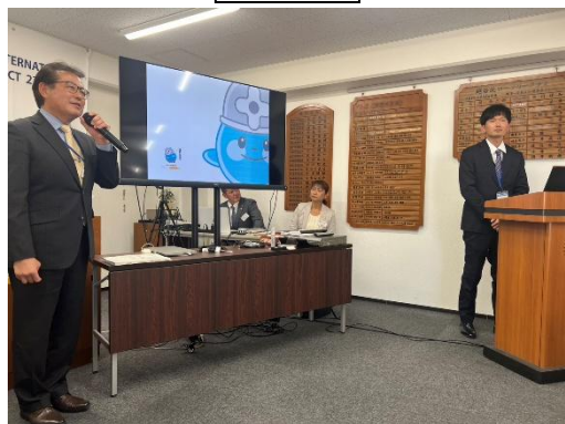
越谷・松伏水道企業団