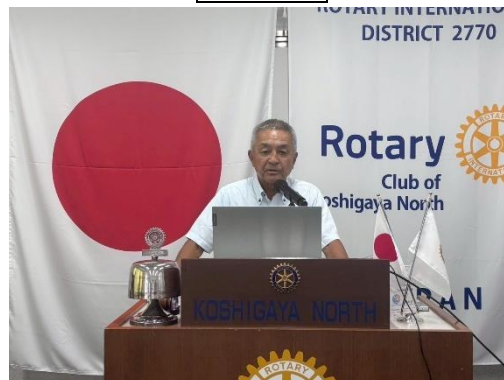
RI2770 地区 管理運営部門