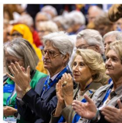
Rotary 2025-26年度国際ロータリー会長フランチェスコ・アレツツォ夫妻

2025-26年度国際ロータリー会長 フランチェスコ・アレツツォ夫妻 (イタリア、ラダザ・ロータリークラブ所属) 矯正歯科医 (キョウセイシカイ)