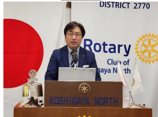
株式会社エフケイ 事業統括本部