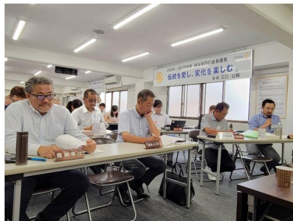
クラブ協議会は、委員長のみならず全会員が参加します。