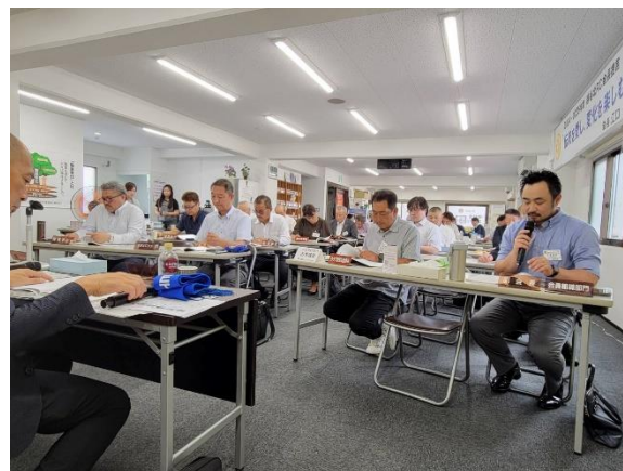
会員組織部門の大島部門委員長より順番に年度計画を発表していきました。