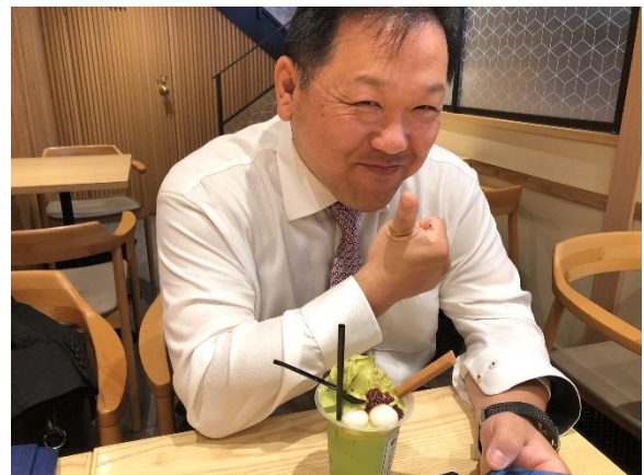
カフェで一服してご機嫌が直りました。