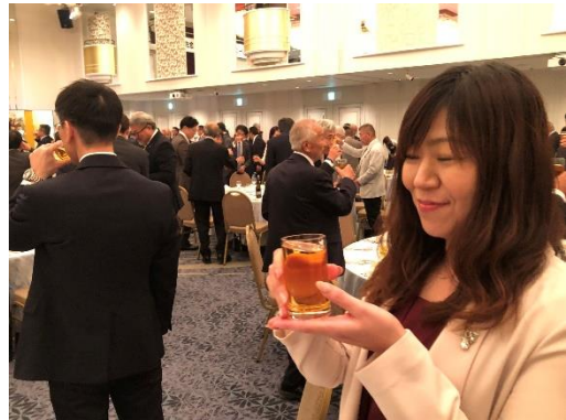
待ちに待った乾杯をしました。