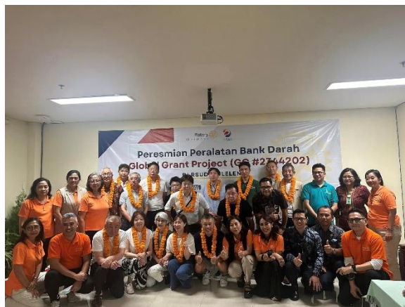
バリ・タマンクラブと記念撮影しました。