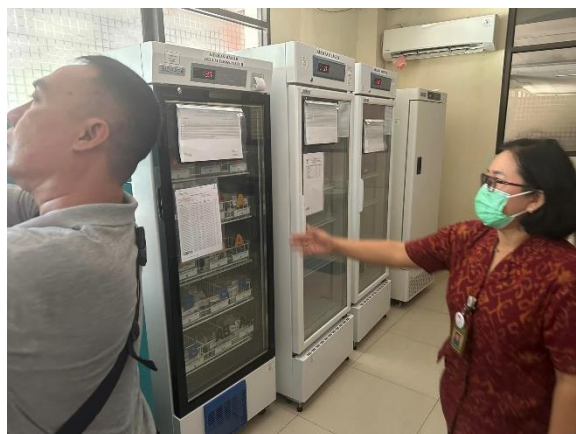
血液冷蔵庫がこちらです。

本年度の重要事業であるグローバル補助金を活用して、インドネシアのバリ島の病院へ血液貯蔵冷蔵庫を寄贈しました。