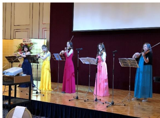
催し物として演奏がありました。