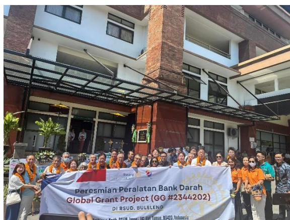
当日はバリ TV や新聞社などメディアも参加しました。