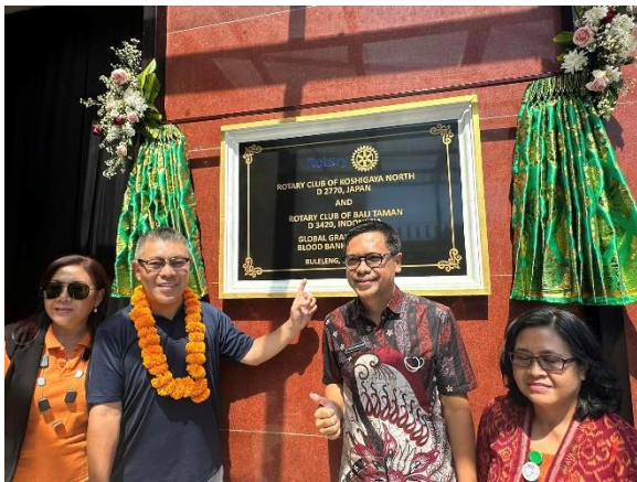
大濱会長が代表して挨拶しました。