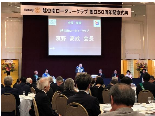
式典が開始され、式典プログラムが進みます。