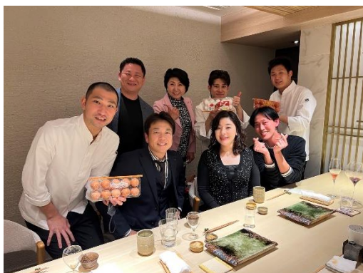
わざわざ富山にお鮓を食べに行ったりもします。