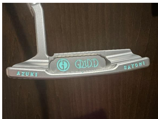
ティファニーブルーのカラーで家族の名前も刻印して

パターですがこれにも少しこだわっており、13万ぐらいでしたが、フィッティングをしてインゴット(つまり鉄の塊から)削ってもらって2か月待ってやっと届いたのがこれです。