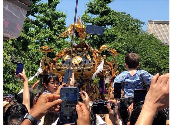
当日は浅草三社祭が開催されていました。

国際奉仕事業の同日、越谷南 RC50 周年式典が浅草ビューホテルで開催されました。