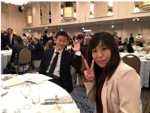
当クラブからは 15 人参加しています。