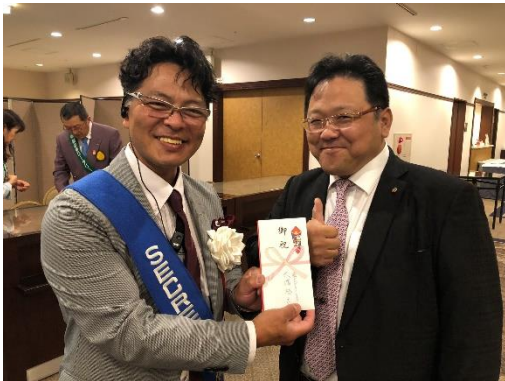
大濱会長からのお祝いを渡しました。