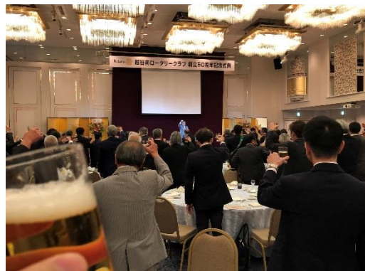
バリ島の国際奉仕事業、越谷南 RC の 50 周年式典に参加された皆様、大変お疲れ様でした。