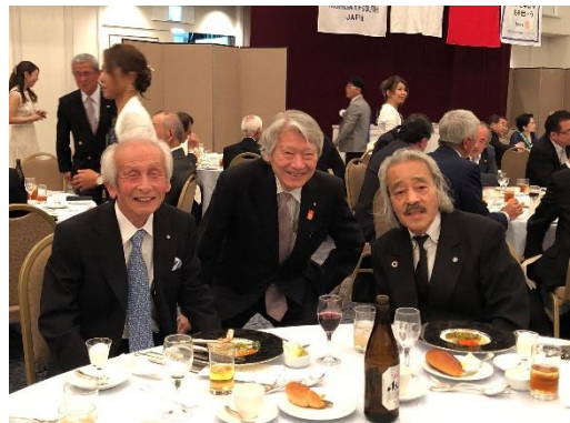
参加している会員も食事を楽しんでいました。