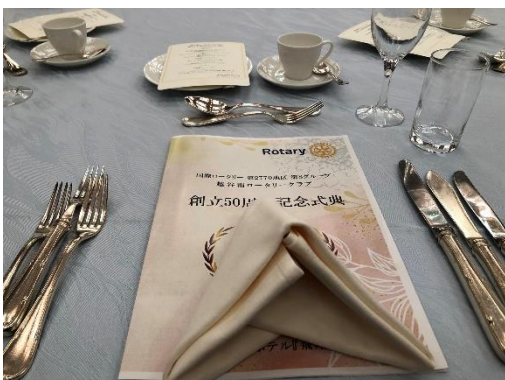
各座席にはプログラムとメニューがありました。