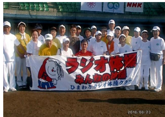
夏季巡回ラジオ体操に参加

また、1953年に各地を巡回して行われる「夏季巡回ラジオ体操」が開始され、越谷市にも6年程前の「越谷市制60周年」の時に夏季巡回体操が越谷総合運動場で開催され、全国に放送されました。「ひまわりラジオ体操クラブ」も参加し、私も参加しました。