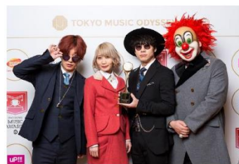
THE YELLOW MONKEY