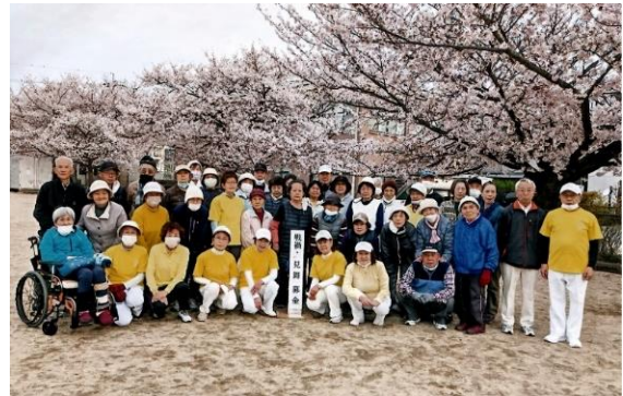
満開の桜の木の下で 20 周年記念撮影