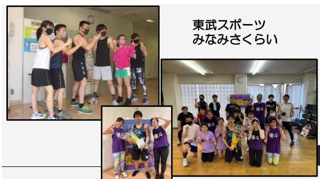
東武スポーツ みなみさくらい

今は週 1 程度でしか行けていないので、週 1 ペース程度では行くと翌日は腕と背筋、腹筋が筋肉痛です。