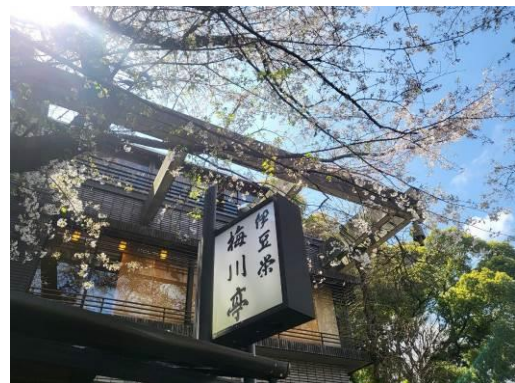
本日の例会場は「伊豆栄梅川亭」です。