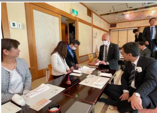
例会から参加の会員も続々駆けつけました。