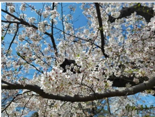
上野公園には見事な桜が咲いていました。