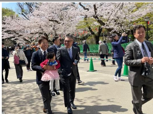
暖かい春の陽気に皆様笑顔でした。