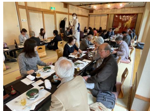
会場はお座敷で良い雰囲気でした。