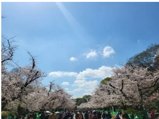
素晴らしい天気にも恵まれました。