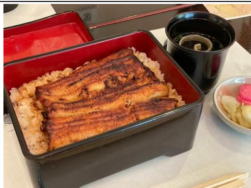
メインのお食事は、鰻重でした。