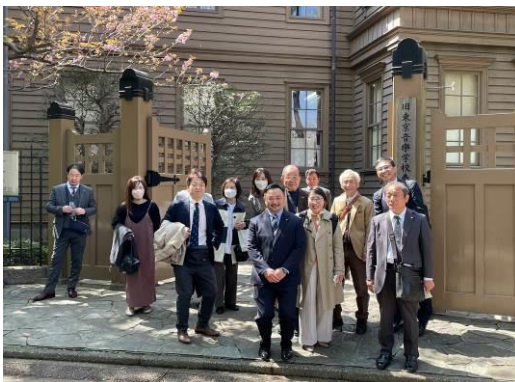
記念撮影もしっかり行いました。