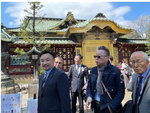
約 1 時間の散策でした。