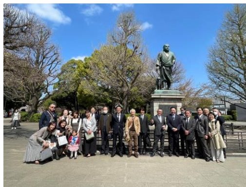
集合場所の西郷像前で記念撮影しました。

観桜例会は上野恩賜公園の散策から始まり、伊豆栄梅川亭で例会、懇親会が行われました。本年度は桜の開花時期に開催ができました。