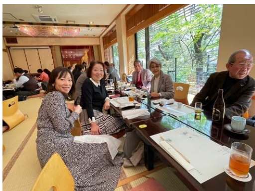
夫人同伴で会員間の親睦も深まりました。