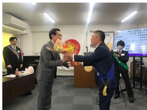
卓話のお礼に花束を贈呈しました。