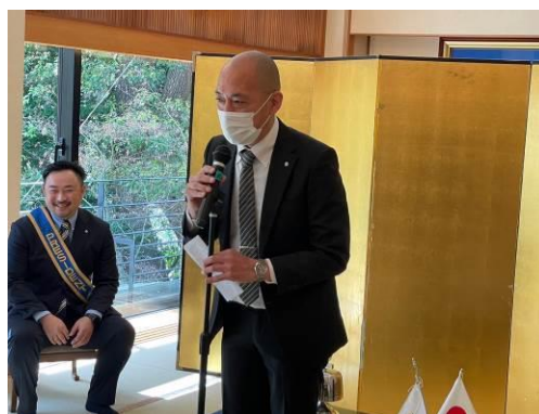
伊藤会員増強委員長からご紹介がありました。