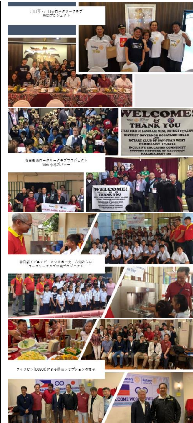
川口南・川口東ロータリークラブ 共同プロジェクト