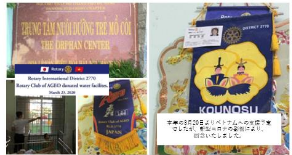
今年の3月20日よりベトナムへの支援予定 でしたが、新型コロナウイルスの影響により、 断念いたしました。