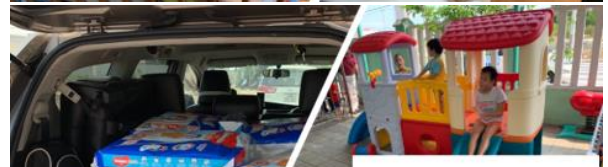
おもちゃ、遊具の高値を行いました。