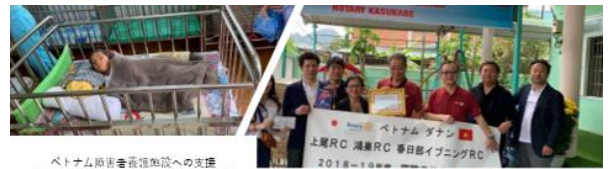
ベトナム障害者施設への支援 ベトナム戦争時の被害者の影響は未だ続いています。