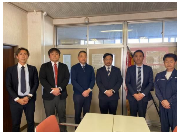
贈呈時の記念撮影も行いました