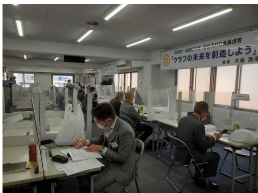
各委員長が半期を振り返っています。

クラブ協議会では、上半期の実施報告に加え、まだ取り組めていないことを中心に発表がされました。大島年度も残すところあと半分。下期には悔いのないように意思表示を行いました。