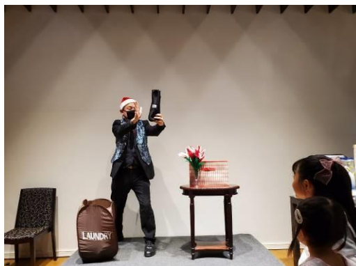
最初のアトラクションは手品です。