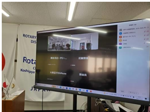
オンラインからの参加者もいました。