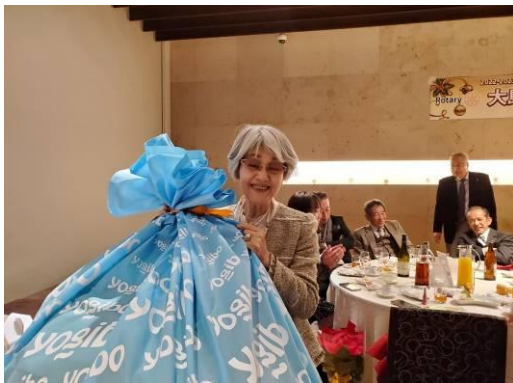
目玉商品の Yogibo を当てたのは太田夫人！