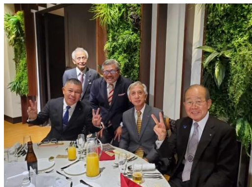
素敵な笑顔を受けました。