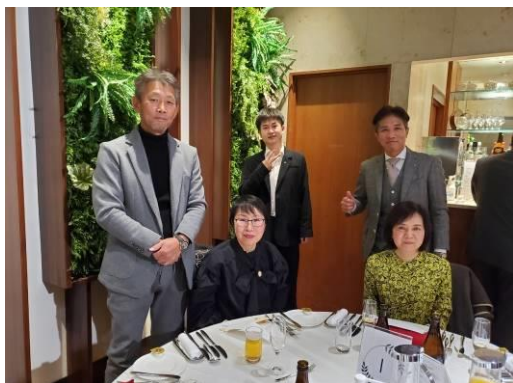
事務局をダンディなメンバーがエスコート。