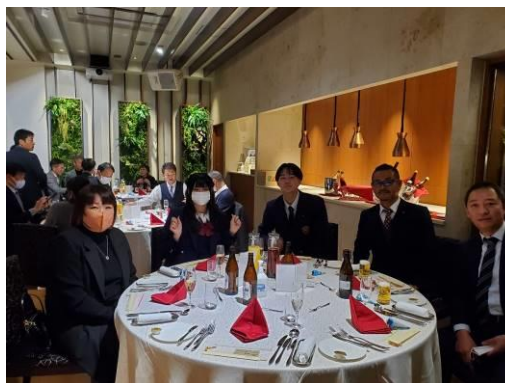
写真撮影にもすぐに協力してくれました。