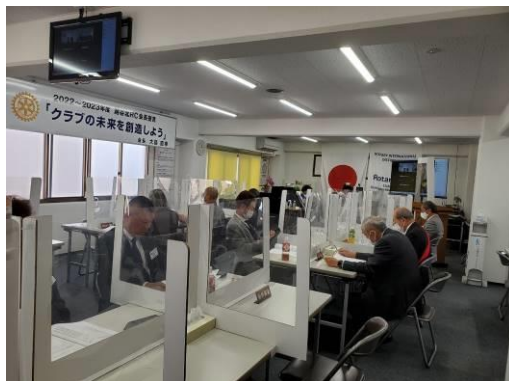
会場の後部からも皆さん真剣なのがわかります。

クラブ協議会では、上半期の実施報告に加え、まだ取り組めていないことを中心に発表がされました。大島年度も残すところあと半分。下期には悔いのないように意思表示を行いました。