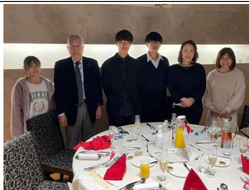
お洒落な光がダンディさを演出しています。

伊藤委員のご紹介でオブザーバーとして参加して 頂きました。今後ともよろしく願いいたします。