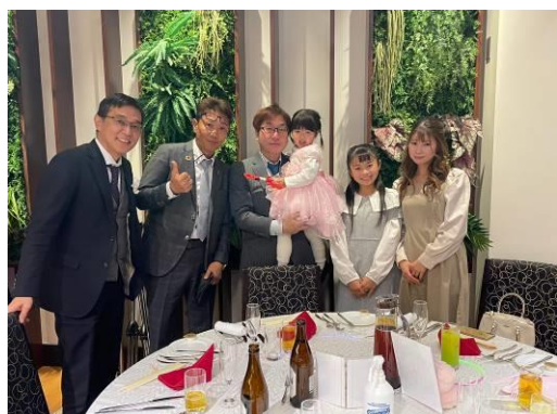
各テーブルで記念撮影