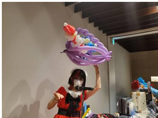
2 番目のアトラクションはバルーンアートです。