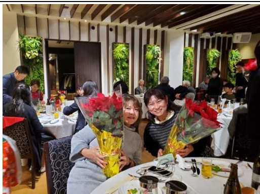
お花がお似合いの女性 2 名です。