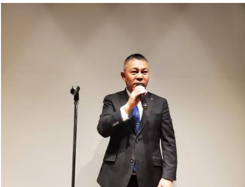
締め挨拶はもちろん大濱エレクト。