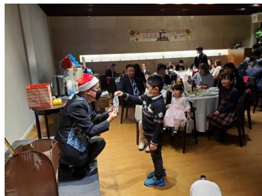
カードマジックに子供たちも夢中になっています。