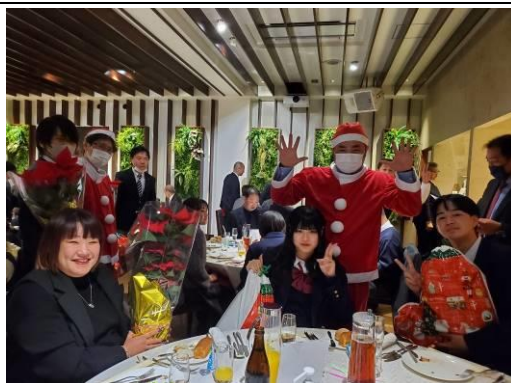
皆さん大喜びです。