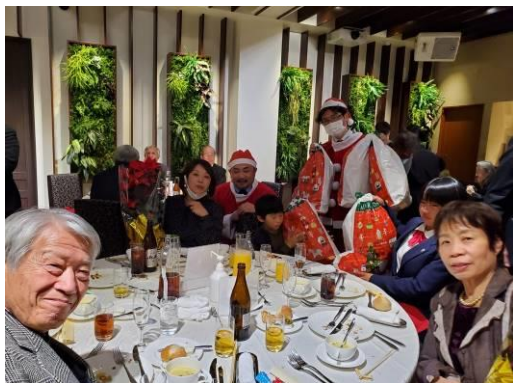
各テーブルにサンタさんがいらっしゃいました。