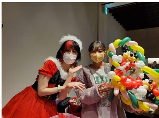
目玉の浦安のネズミさんを勝ち取りこの笑顔。