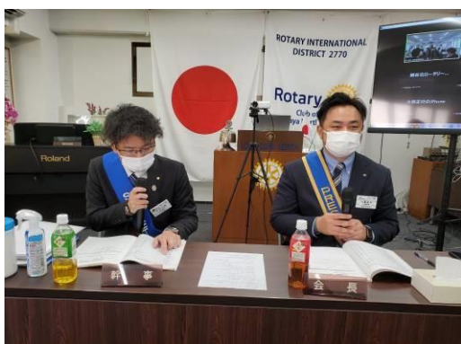
例会終了後第 5 回クラブ協議会が開催されました。

例会終了後には、第 5 回クラブ協議会が開催されました。江口幹事の司会のもと、スムーズに会が進行されました。