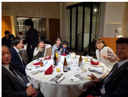
大熊ファミリーの参加有難うございました。