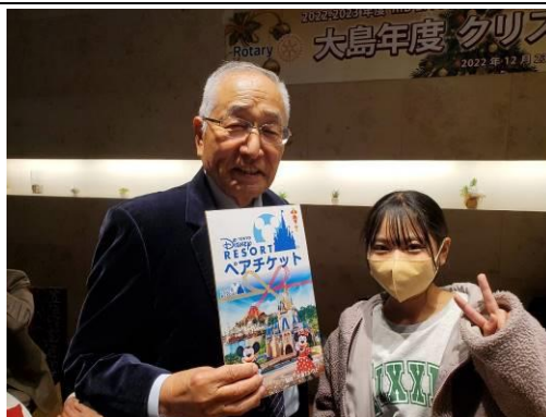
松井さんはペアチケット！