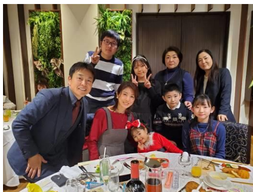
今回最大参加人数!ファミリー感あふれる写真です。