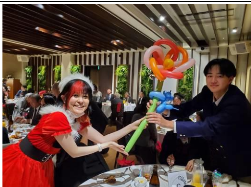
その場即興で作成してくれました。