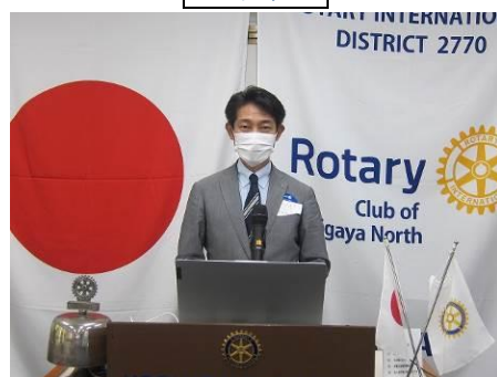
幸手ロータリークラブ 株式会社アメック