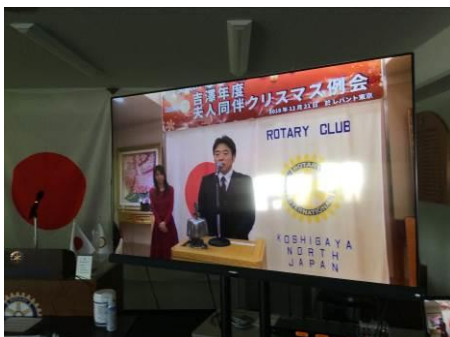
会場モニターでクリスマス例会を振り返りました。