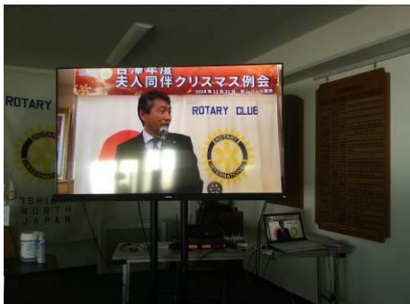
吉澤年度夫人同伴クリスマス例会が上映されました。