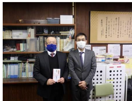
お祝いを贈呈しました。