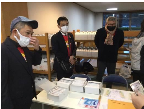
参加者には、須賀商店のおいしい卵とお菓子を配布