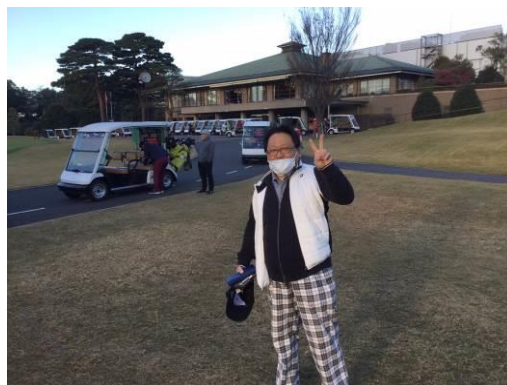
市川会員が元気よくプレイに向かいました