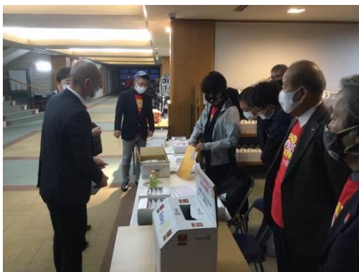
プレイをしない会員もお手伝いとして参加しています