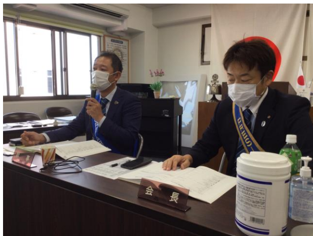
会長、幹事がクラブ協議会を進行します。

例会終了後には須賀年度最後のクラブ協議会が行われました。新型コロナウイルスの影響が続いて各委員会とも予定通りの活動は困難なものでしたが、そのような環境の中でも各委員会は知恵を絞り、工夫を凝らし活動を行いました。1年間の集大成が発表されました。