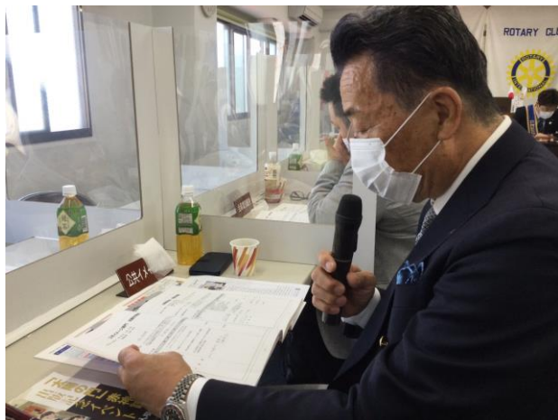
各委員長が1年間の活動を報告しました。