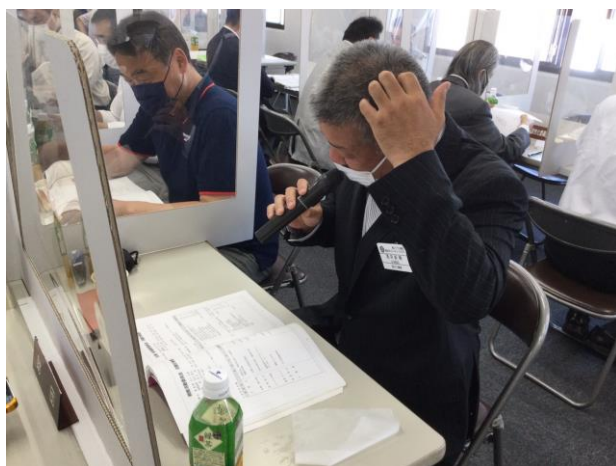
出席会場運営委員長は、今回も撮影を恥ずかしがっていました。