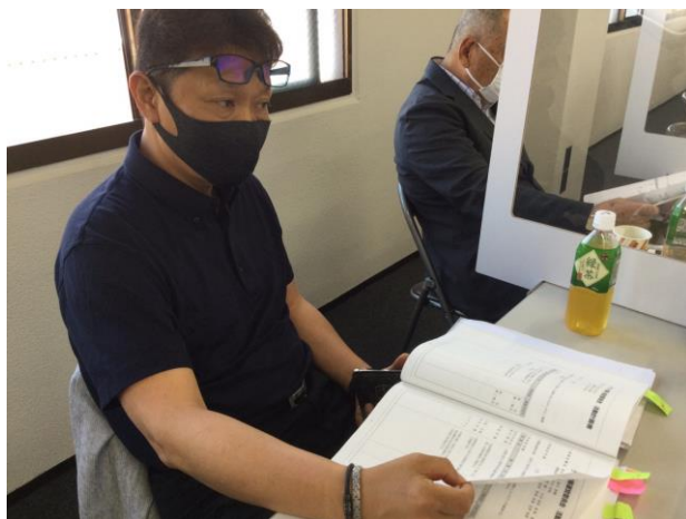
次年度幹事は真剣に報告を聞いていました。