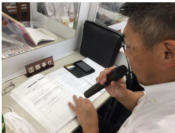
コロナ環境でも国際奉仕委員会は積極的な活動を行っていました。