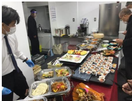
各人に1つずつトングも渡されています。