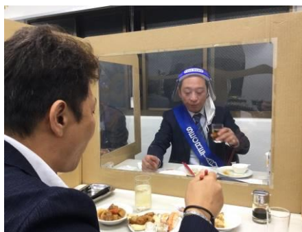
飲食があるため、フェイスガードも配布されました。