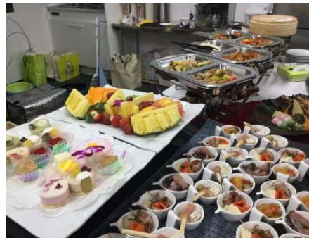
料理が個別に持てるように配慮されていました。