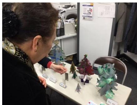
例会場にはツリーアートも飾られました。 忘年夜間例会お疲れ様でした。