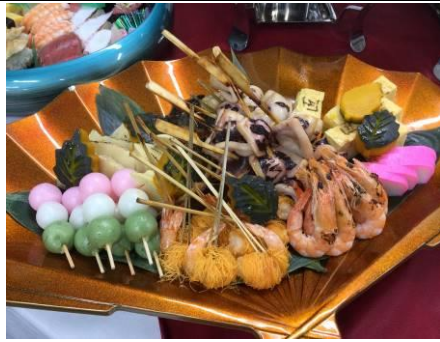
豪華な料理も振舞われています。