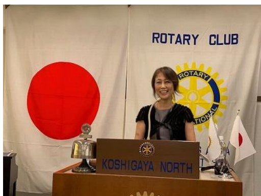
日本看取り士会看取りステーション埼玉