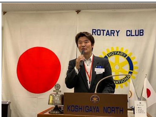
会員増強維持部門委員長