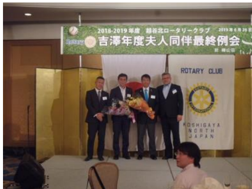
吉澤年度から小宮山年度へバトンタッチ！