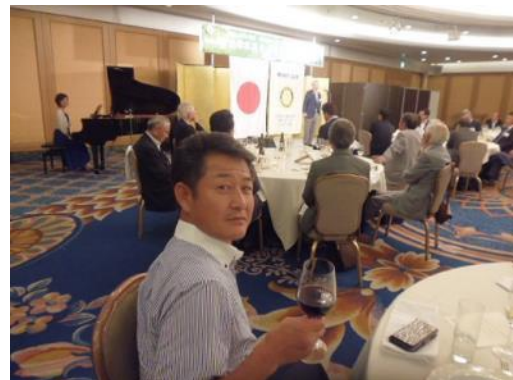
ワイングラスがよく似合っています☆