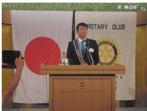
吉澤会長最後の会長卓話