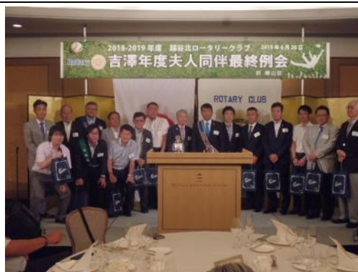
出席 100%の皆さんです

吉澤年度の 1 年間を締めくくる最後の例会は、ホテル椿山荘東京で盛大に開催されました。多数の会員が参加しています。1 年間お疲れ様でした。