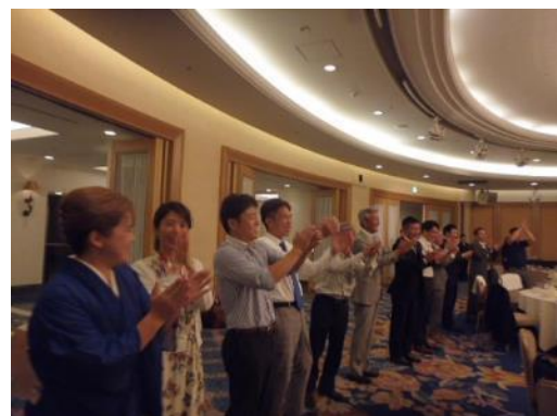
皆さん楽しんでいただけた様子