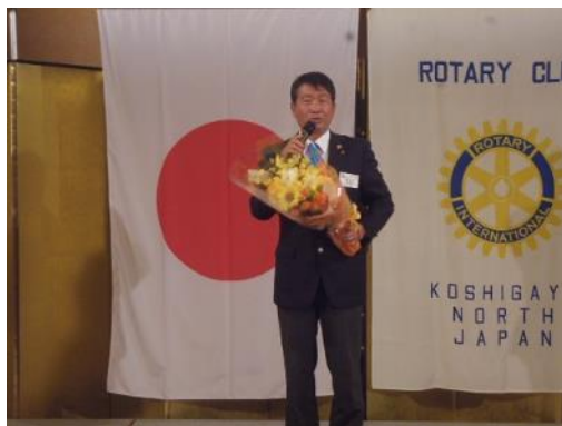
吉澤会長、大変お世話になりました