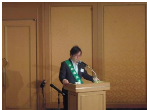
吉澤年度最終例会がスタート！