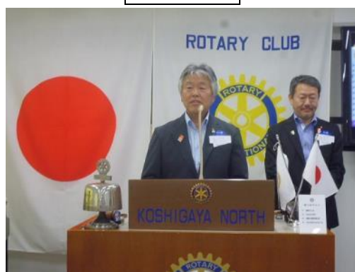
越谷ロータリークラブ