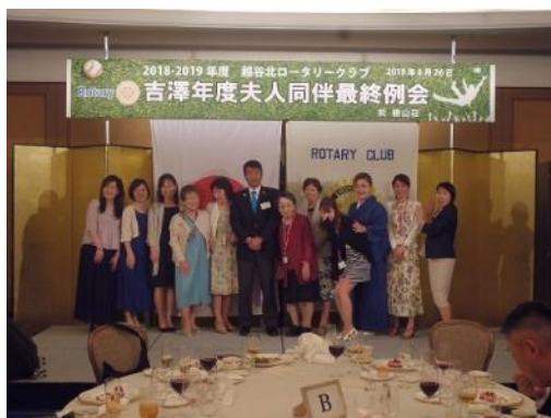
ご来場いただいた女性たちと会長