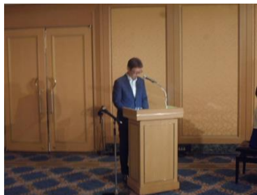
懇親会が始まります