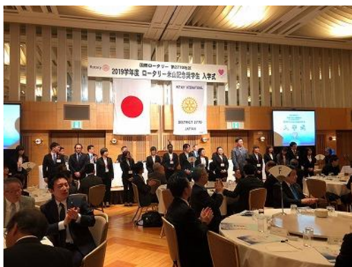
ラフレさいたまにて盛大に入学式が行われました