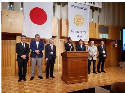
ドリスさんが挨拶をしています