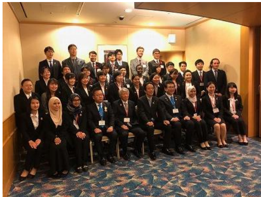
皆で記念撮影をしています