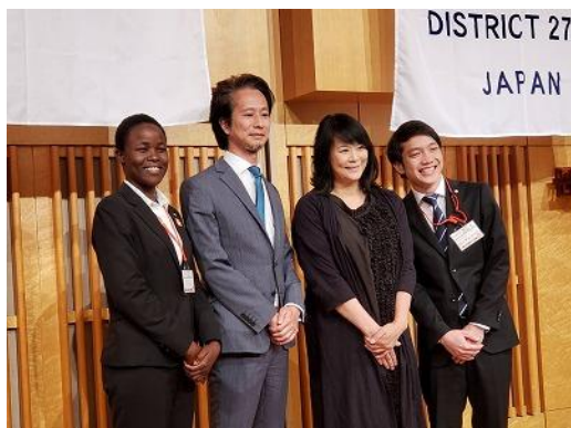
指導教員との記念撮影です