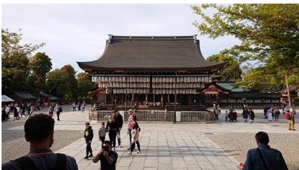
京都らしい作りが素敵です

会員親睦と職場見学とを兼ねて 4/16～17 の 1 泊 2 日で京都方面へ旅行に行きました。