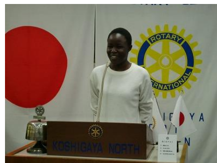
2019 学年度米山記念奨学生