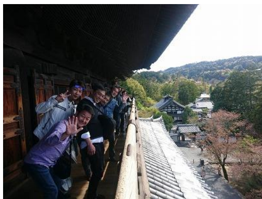
最高のロケーションで、盛り上がっています