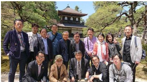
最高の天気です迎えた親睦旅行