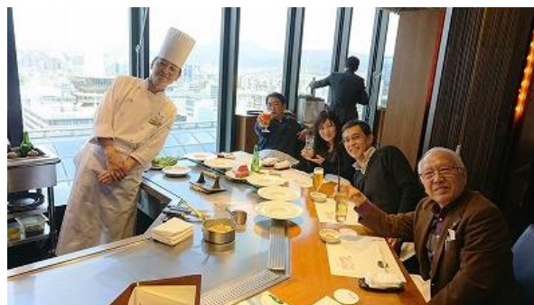
食事最高級、舌鼓が響いています