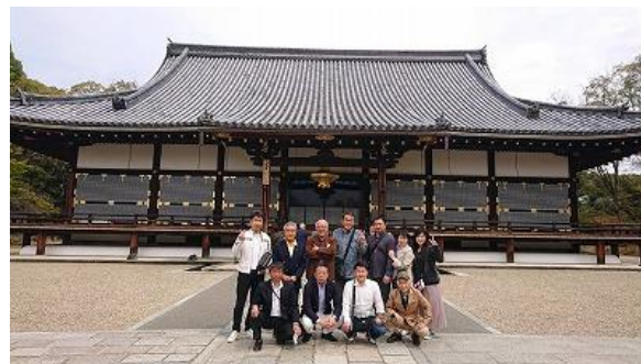
2 日目も京都で足跡を残しています