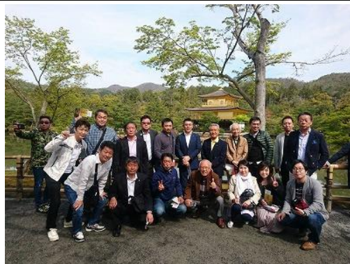
金閣寺の見学は外せません