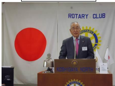
ロータリー情報・雑誌委員会