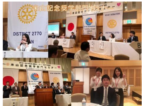
部門セミナーの様子です。