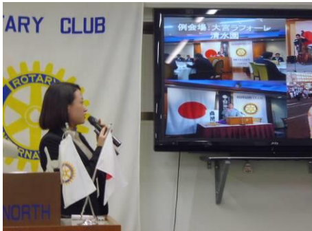
米山記念奨学生としての活動報告を行いました。