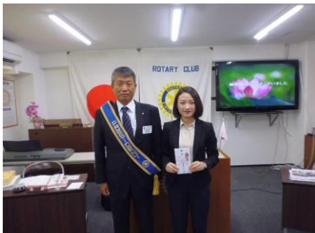
活動卓話ありがとうございました。