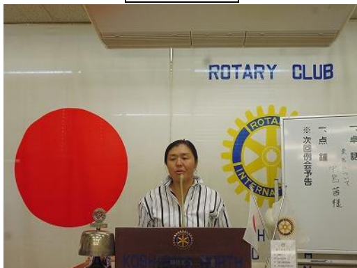
みどりの丘乗馬クラブインストラクター