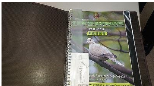
長島年度バインダー式年度計画書

そして、今でも伝説の年度計画書は、長島年度バインダー型年度計画書です。ちなみにその時の幹事は、私でした。以前に何人かの会員の方から並べるとバランスが悪いなどと言われました。