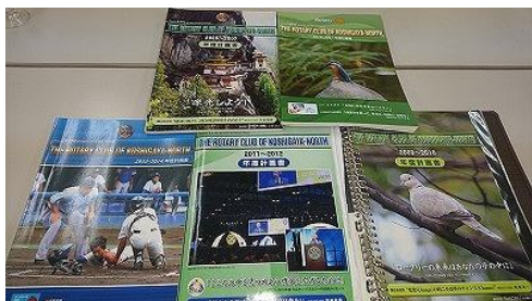
石川輝次会員が撮った写真が 表紙に使われた年度計画書

1 番豪華な年度計画書は関森年度の年度計画書で、紙質や名刺入れやロータリー用語メモなど色々工夫されていました。