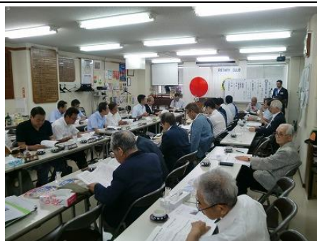
年度計画書を基に協議が行われました

例会終了後、引き続き例会場において第 2 回クラブ協議会が執り行われました。会長提言および前回例会における会長・副会長・部門委員長・S.A.A.からの所信表明を受け、各小委員会より年間の活動計画の発表がなされました。質疑応答を経て、閉会となりました。