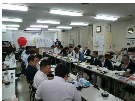
緊張感溢れる例会場