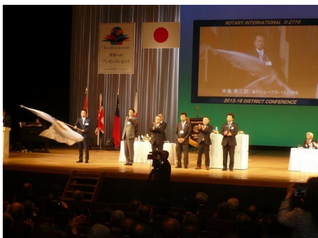
第 8 グループ クラブ入場・紹介