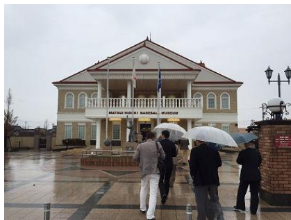
松井秀喜ミュージアム