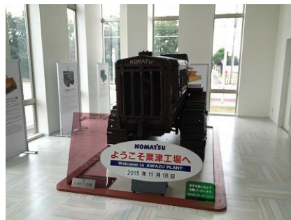
小松製作所 栗津工場