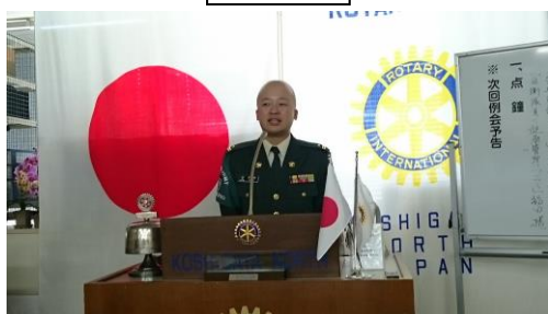
東部方面総監部総務部広報室企画幹部