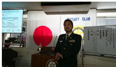
朝霞駐屯地業務隊衛生科長