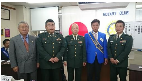
朝霞駐屯地の皆様ありがとうございました。