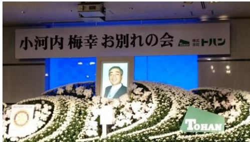
平成 28 年 2 月 17 日 ギャザホールにて ご冥福をお祈りいたします。