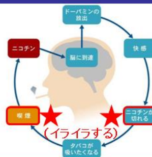
図:ノバルティスファーマ提供