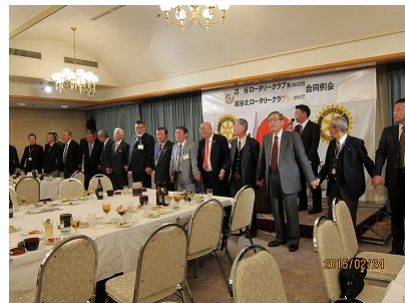
最後は皆で手にて繋いで