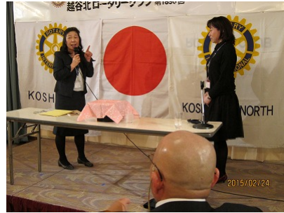
越谷 RC 余興 会員による手品