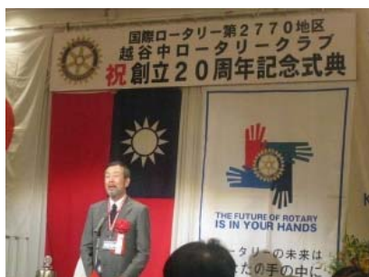
越谷中クラブ 20 周年の時の様子

ロータリーは、ある一人のアメリカ人のビジョンによ って始まりました。その人の名前は、ポール・ハリス。 シカゴで弁護士として働いていたハリスが、世界初の ロータリークラブ(シカゴ・ロータリークラブ)を設立した のは、1905年2月23日のことです。ハリスは、多様な 職業を持つ人びとが集まり、アイデアを交わし、生涯 にわたる友情を培うことのできる場として、ロータリー を設立しました。「ロータリー」という名は、当時、各メ ンバーの職場を持ちまわりでミーティング場所として いたことに由来します。ハリスのビジョンから始まった ロータリーは、現在120万人の会員を擁する組織へと