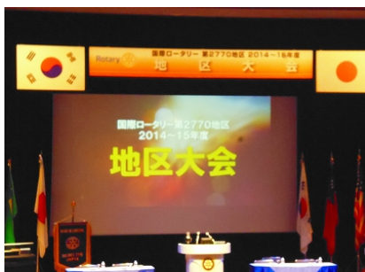
大会テーマ「明るく・楽しく・元気よく」

2014年 11 月 15 日・16 日 大宮ソニックシティ於 (当クラブ第 1883 回振替例会)