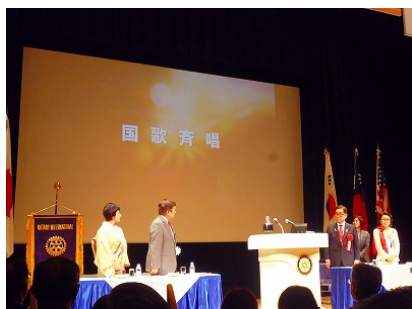
日本・韓国の国歌斉唱